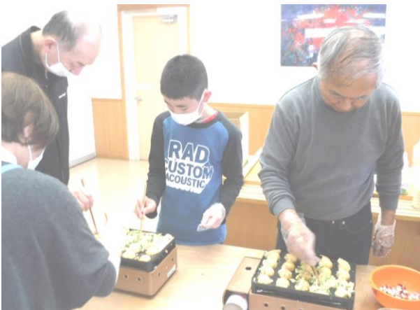
保護者会たこ焼きパーティー開催