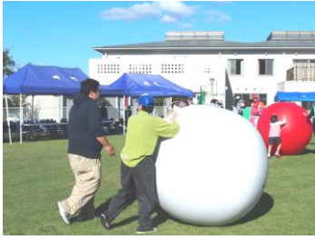
毎年恒例の大玉ころかし