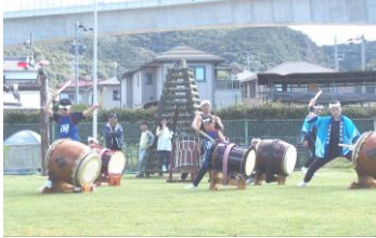
太鼓集団「潮」の演奏