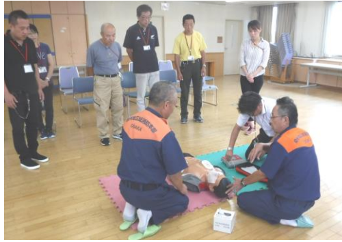
心肺蘇生法についての説明を受けました