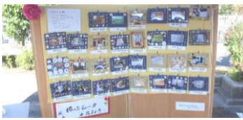
昨年のアート展より