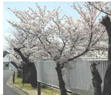
今年も見事に満開です！

今年もエントランスに、五月人形が登場しました。堂々とした風格の人形のように、皆が前向きな気持ちで行ければと思います。