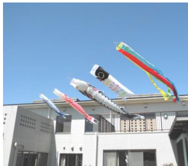
青空の中を彩ります！