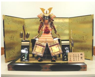
力強く堂々とした風格です！