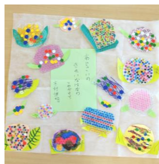
皆で作ったあじさいです

先日、生活介護と就労継続支援B型の仲間たちと「あじさい」作業をしました。私が某テレビ番組に影響を受けて、それに添える俳句