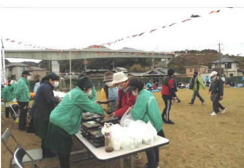
皆さん！お弁当ができましたよー！