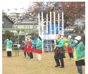
久しぶりに皆で歌って楽しく踊ることができました！

開催でき、利用者の皆さんの喜ぶ顔が見れて本当に良かったと思います。まだまだ油断はできませんが、引き続き、感染症対策を取りながら、イベントを増やしていければと思います。民生委員の皆さま、美味しい、楽しいひと時を作ってください、本当にありがとうございます。