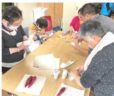
おいしく焼けますように！