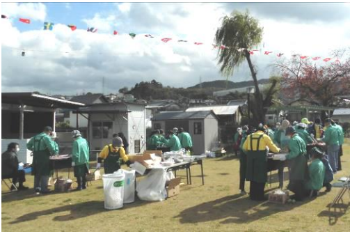
美味しそうな匂いがしてきました！

昨年新型コロナウイルスの影響で中止となった、民生委員さん主催のバーベキュー大会が11月23日(火)に愛の家運動場にて約2年ぶりに開催されました。