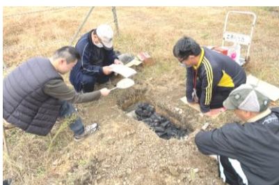
皆で火起こしに全集中！

毎年好評の、焼き芋大会を今年も企画しました。利用者さんには内緒にしておこうと思って、公表はしませんでした。どこから聞きつけたのか、地面に穴を掘る下準備を見られていたからなのか、「焼き芋はいつするの？」「芋は金時なの？」といった質問があり、どこでその情報がリークされたの？ 文春砲ですか？ と思った次第です。