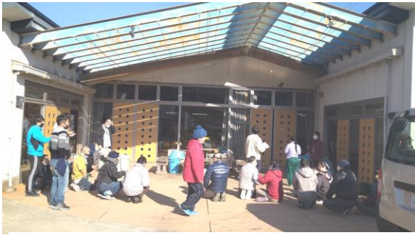
皆さん迅速に避難することができました！

工房みさきの施設内に、け ただましい警報が鳴り響き、 職員の「火事だあー！」の 知らせで、利用者さんたちは 活動の手を止めて一斉に広場 へと迅速に駆け出しました。