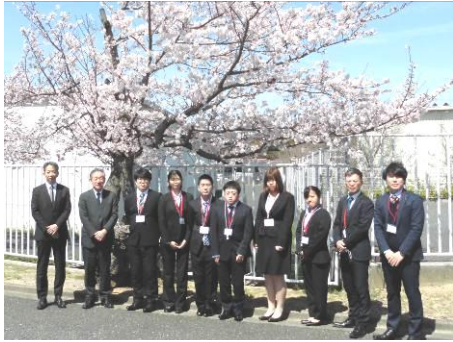
満開の桜の下で決意も新たに！