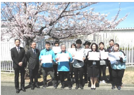
次の5年先、10年先を目指します！