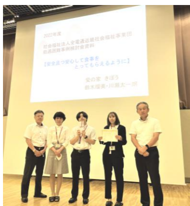
より良い支援を目指します！

7月24日に事業団本部にて法人事例発表会があり、「きぼう部門」が優秀賞を受賞しました。