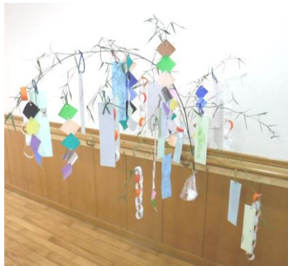
かがやきの皆さんと作りました