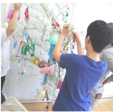
きぼう七夕レクの様子より