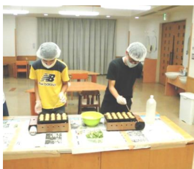
皆さんもう慣れたものです！

ませてくれる保護者会の方、当日手伝ってくれたスタッフの皆さんありがとうございました。