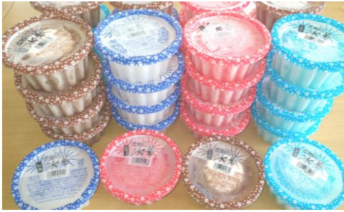
どれにしようか迷ってしまいますね!