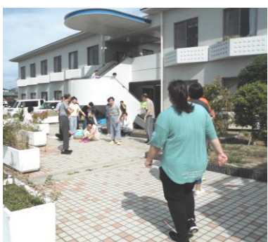
素早く避難できました!

や訓練の感想も色々とお出ししたが、反省は次回に生かして、今後もしっかりと防災意識を高めていきたいと思えます。